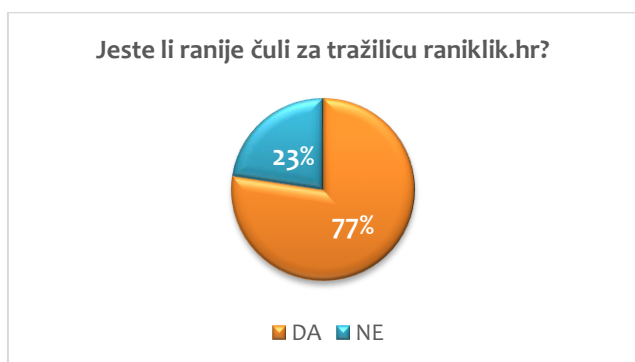
Slika 1. Prikaz upoznatosti sudionika s tražilicom raniKLIK i njenim funkcionalnostima

U okviru drugog ciklusa inovativnih edukativnih radionica 10. i 17. ožujka 2021. predstavljena je HURID-ova baza stručnjaka za rani razvoj djece – tražilica raniKLIK.hr te su sudionici upitani jesu li ranije čuli za tražilicu i jesu li zainteresirani istražiti (ili već jesu) njene funkcionalnosti. Na slici 1. prikazan je postotak sudionika s obzirom na prethodnu (ne)upoznatost s tražilicom, kao i postotak sudionika koji (ne) planiraju u budućnosti istražiti njene funkcionalnosti. Ponuđeni odgovori su bili dihotomni (da/ne).